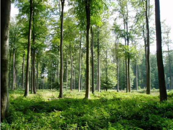
Forêt de Soignes (B)