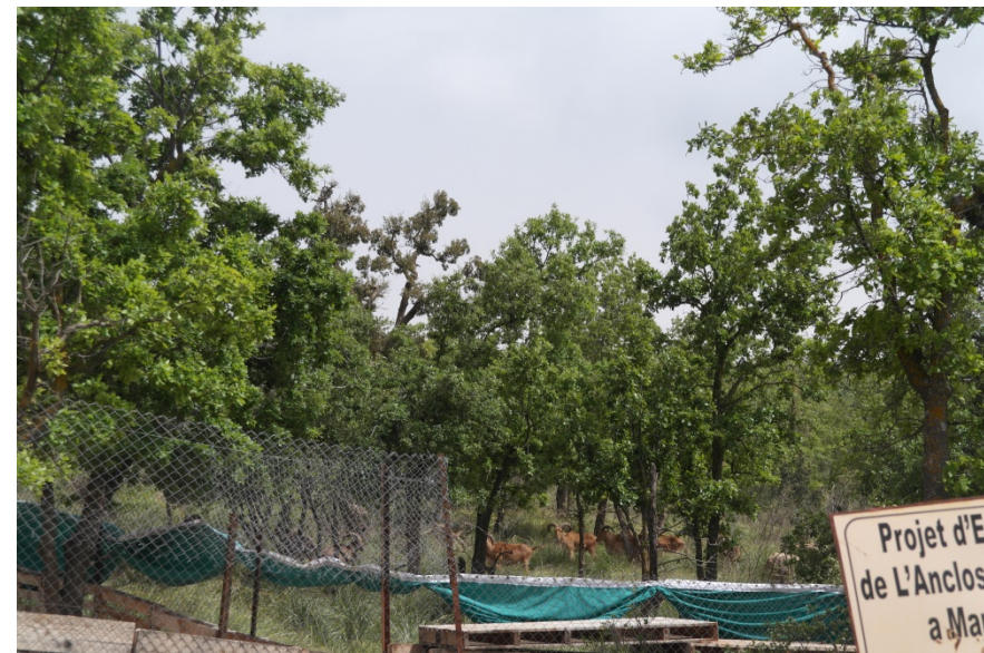
Enclos d'élevage de Mouflon à manchettes