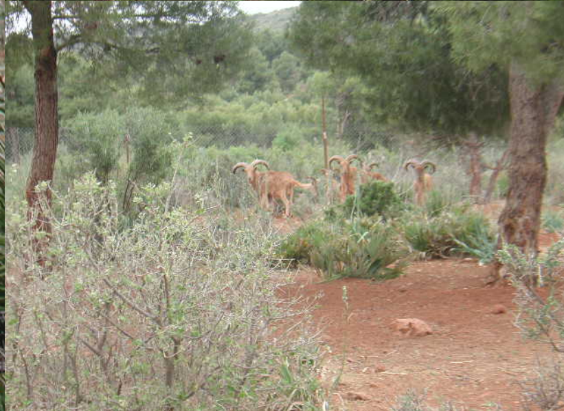
Mouflon à manchettes