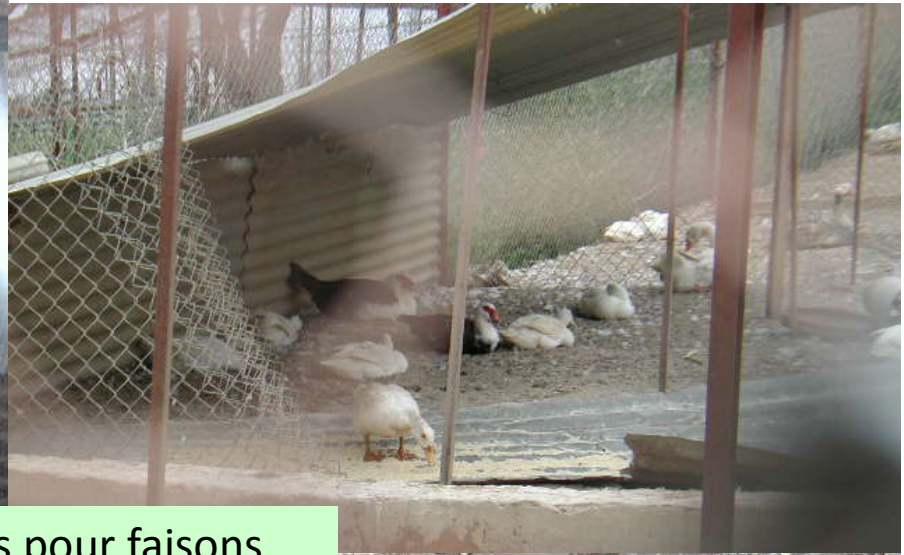
Volières pour faisans