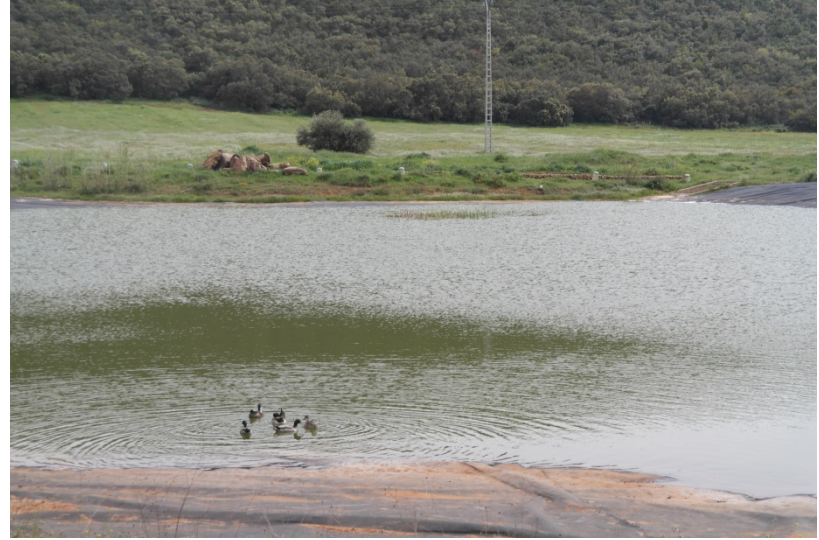
Point d'eau pour les animaux