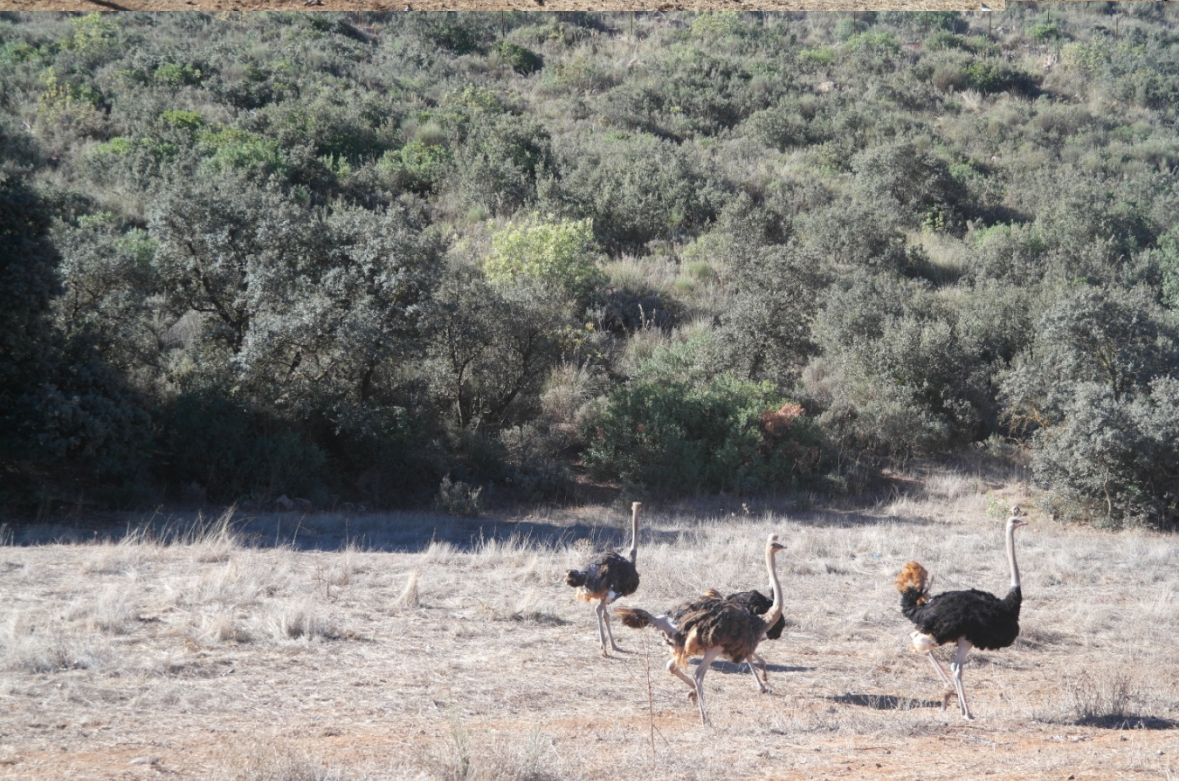
Enclos d'élevage de l'autruche