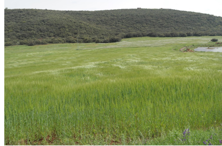
Culture de céréales pour les herbivores