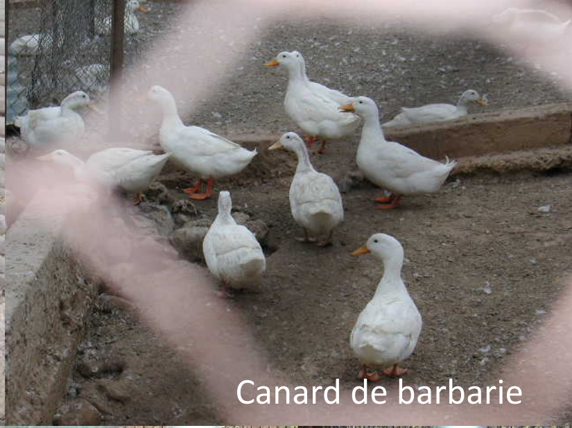
Canard de barbarie