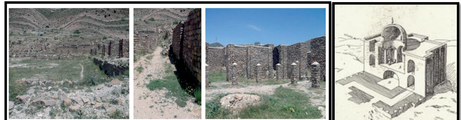
De gauche à droite : Etat actuel de la grande cour ou grand bassin; vestibule d'entrée à Dar El Bahar ; la cour centrale du palais du souverain, la Coupe du palais