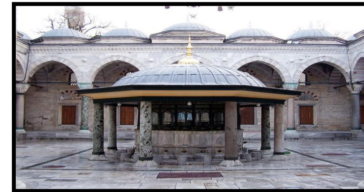
Cour de la mosquée

A l'aide du cours, le texte et les différentes figures répondez à ce qui suit :