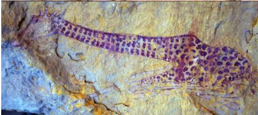
Figure 3 : Peinture rupestre d'une girafe disparue –Tassili- [Donzé, 2018]

L'homme Néolithique a pratiqué le polissage de la pierre et devenue éleveur d'animaux.