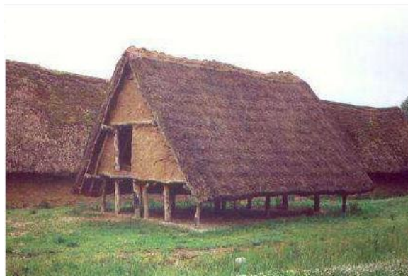
Figure 5. La hutte du Néolithique [Web1]

A cette époque, les hommes bâtissent de grandes huttes en torchis (mélange de paille et de boue) recouvertes d'un toit de chaume. Elles peuvent abriter 20 à 30 personnes (Fig. 5).