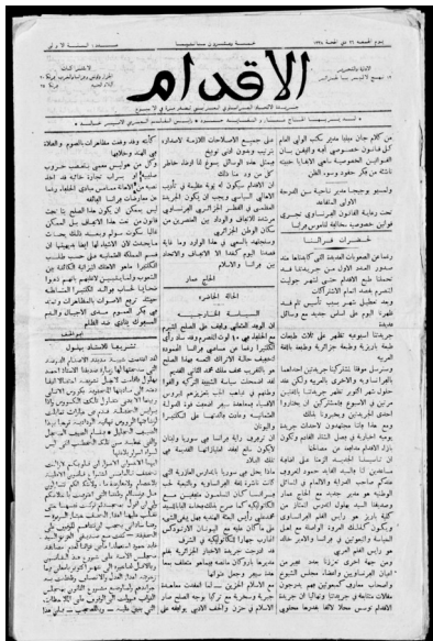
صورة 1 جريدة الاقدام

أصدر هذه الجريدة الناطقة بالفرنسية في فيفري 1919 ثم بالعربية والفرنسية جميعا في سبتمبر 1920م "الأمير خالد" و"الصادق دندان" و "الحاج عمار" ، و تعد الإقدام من الجرائد الوطنية التي أثرت تأثيرا عميقا في الحياة السياسية و الفكرية بالجزائر في مطلع العقد الثالث من القرن العشرين فقد أسهمت إسهاما مشرفا في ترقية الوعي الوطني و بلورته في الأذهان و التمكين له في القلوب ، وكانت تصدر أسبوعيا بالعربية و الفرنسية معا وكان الأمير خالد لا يزال ينادي في هذه الجريدة ( بوجوب إصلاح الحالة في قطر الجزائر على قاعدة تسوية الجزائريين بالفرنسيين في كل شيء و دخول الجزائريين لمجلس النواب). و قد ظلت تصدر إلى شهر مارس سنة 1923م بعد أن صدر منها زهاء 120 عددا و ذلك بعد أن حوكم الأمير خالد على أفكاره و مبادئه التي كان يروج لها الأمير فنفي الأمير ، و أوقفت الجريدة و كانت تنشر قصائد شعرية للشعراء المعروفين على عهدنا ، كما كان ينشر فيها الأمير خالد نفسه قصائده الوطنية ، كما كانت تنشر مقالات أدبية جميلة 3 مرناض عبد الملك : أدب المقاومة الوطنية في الجزائر (1830-1962) ، دار هومة للطباعة و النشر ، ص. 204.