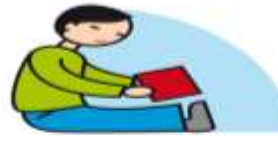
Manque de jeux imaginatifs