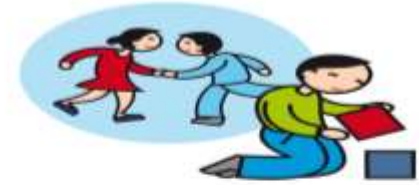
Ne joue pas avec les autres enfants