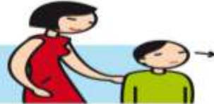
Manque de contact oculaire