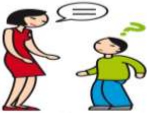
A du mal à comprendre et à se faire comprendre