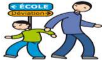
N'apprécie pas les changements