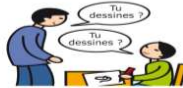
Utilise le langage de façon écholalique