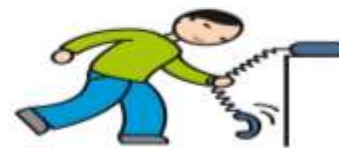
Utilise les objets de façon atypique