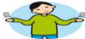
Présente des comportements bizarres