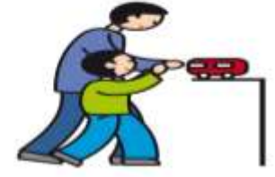
Indique ses besoins en utilisant la main d'un adulte