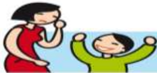
Rit de façon inappropriée