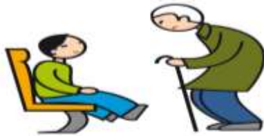
Comprend mal les conventions et les règles sociales