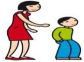
Manifeste de l'indifférence