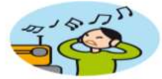
Peut être hypersensible aux sons, aux odeurs ...