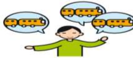
Parle de façon incessante sur un sujet particulier