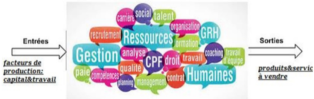
Vue de l'entreprise par l'approche managériale

- Les propriétaires de l'entreprise : se sont des actionnaires ayant uniquement un objectif financier (maximiser le profit).