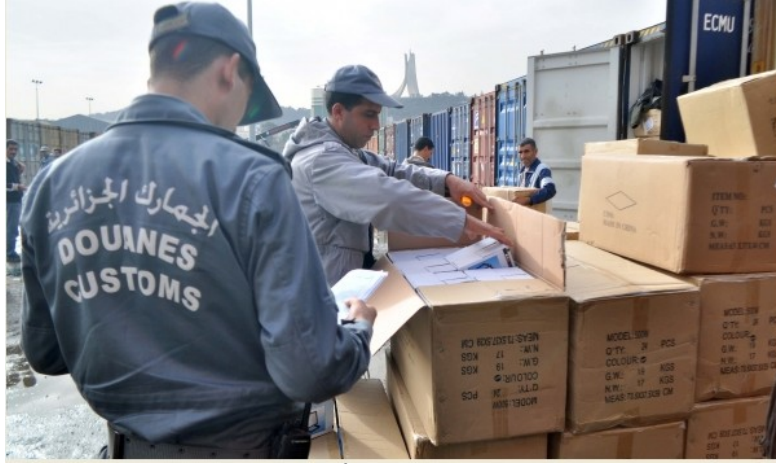
إجراء التفتيش من طرف أعوان الجمارك