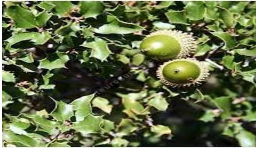
Chêne kermès - Quercus coccifera