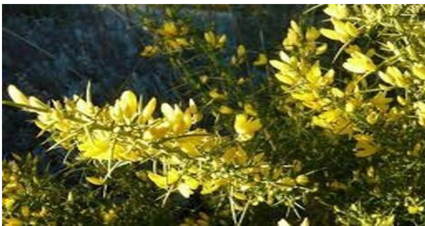
Argéras - Ulex parviflorus