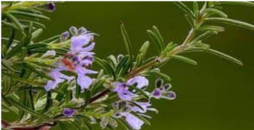
Romarin - Rosmarinus officinalis