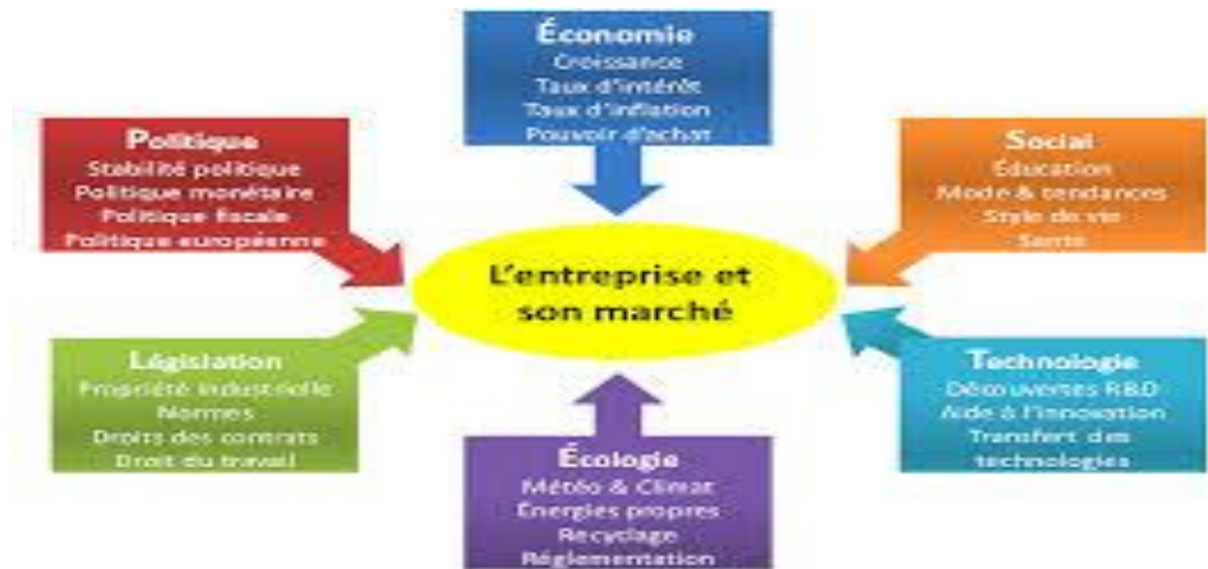
Figure : méthode PESTEL