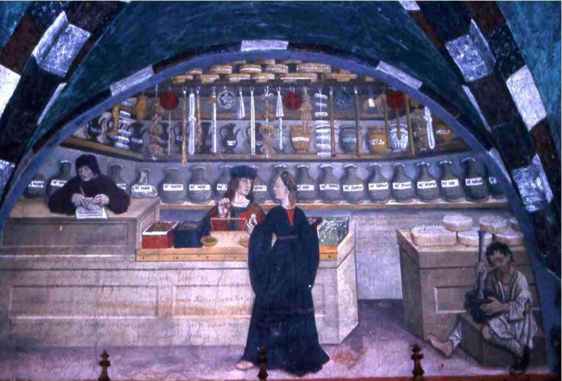
Châteaud'Issogne(Italie, Val d'Aoste) : une des fresques des métiers, ici l'apothicairerie (vers 1400)