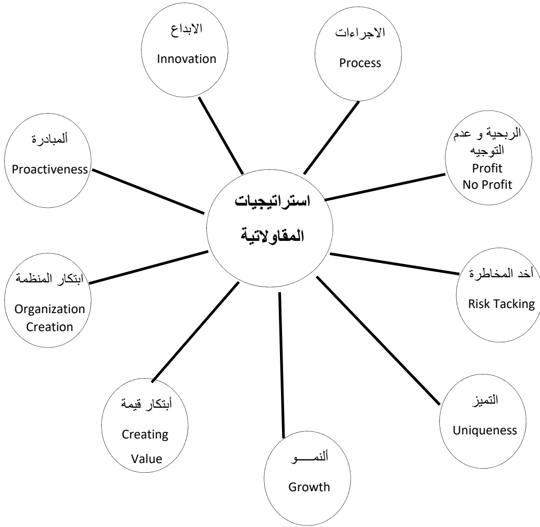
الشكل 1. استراتيجيات المقاولاتية

المصدر : د. بلال خلف السكارنة، الريادة و إدارة منظمات الأعمال، ص46