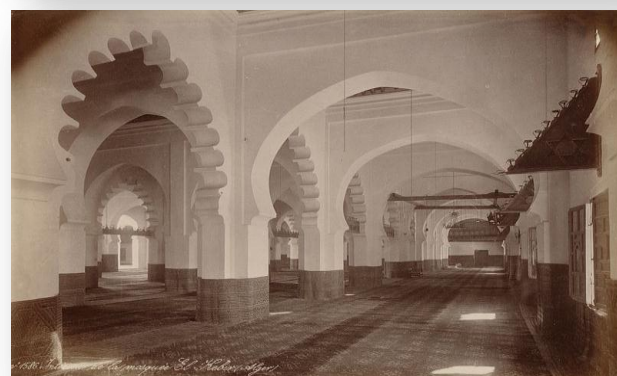
La salle de prière