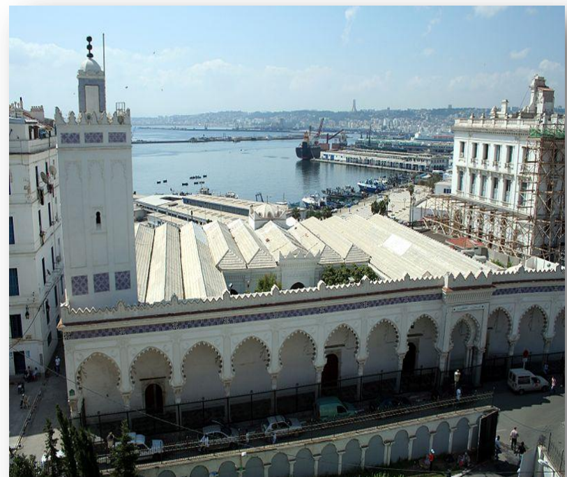
Vue de l'extérieur