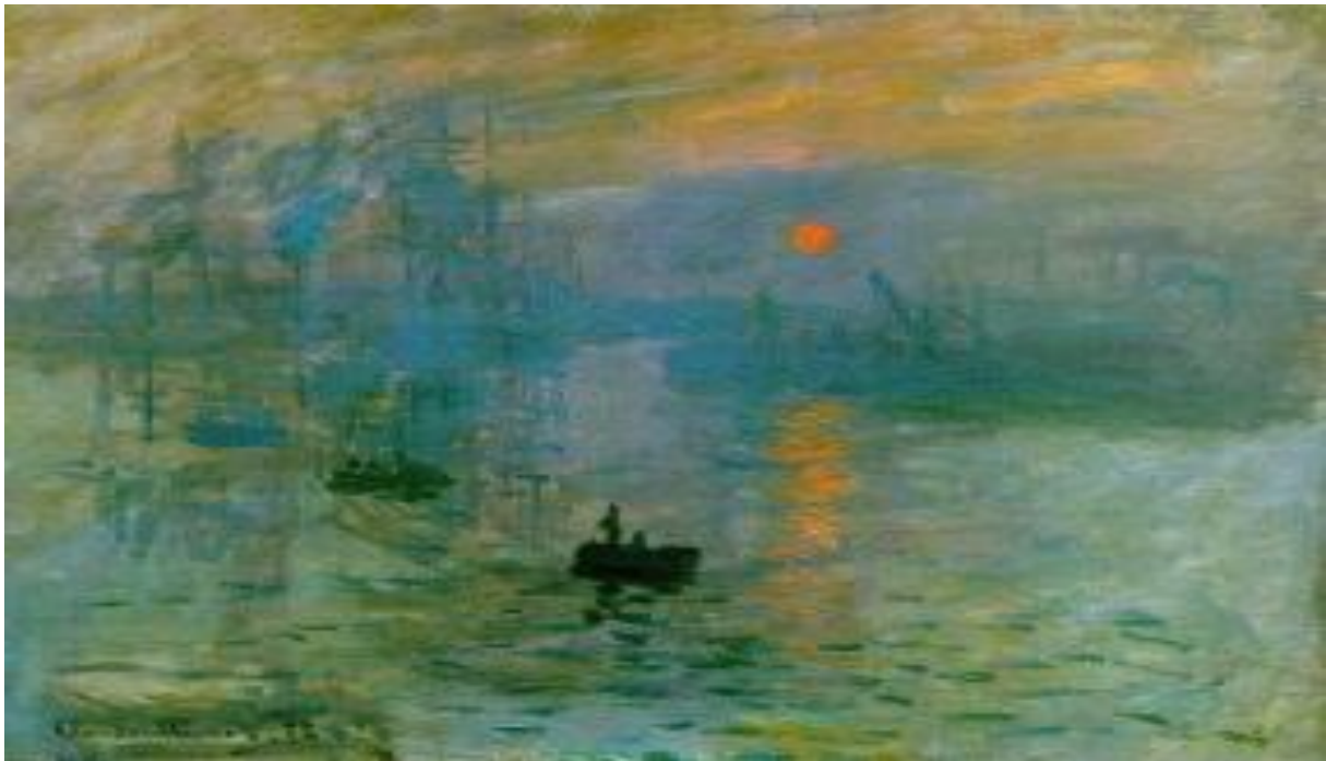
Impression, soleil levant 1872 claude monet

عرضت هذه اللوحة سنة 1874م، مع أعمال أخرى للتأثيريين، في معرض الفنان الفوتوغرافي ندار (Nadaق). ولقد واجهت موجة من الانتقادات من النقاد والناس على حد سواء، واللوحة ليست عملا وظيفيا، بل هي عبارة عن الشعور والاحساس الذي شعر به الفنان في فترة من فترات اليوم وهو يرسم اللوحة، وهي عبارة عن طلوع الفجر على مرفأ لنهر، ويصعب التمييز فيها بين الماء والسماء، فقد اختلطا في زرقة موحدة، تحت حمرة الشمس.