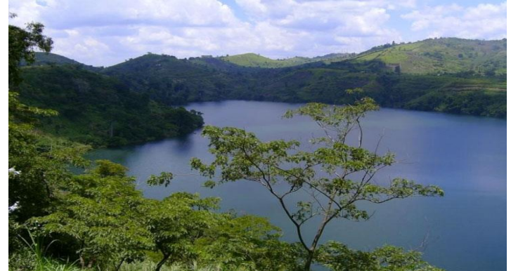
Au cœur de l'Afrique les grands lacs