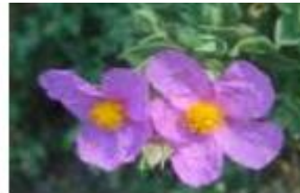
Le ciste cotonneux