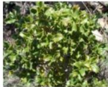
Le chêne kermès Quercus coccifera (Fagacées)