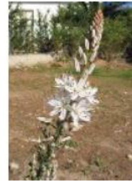
L'asphodèle Asphodelus (Liliacées)