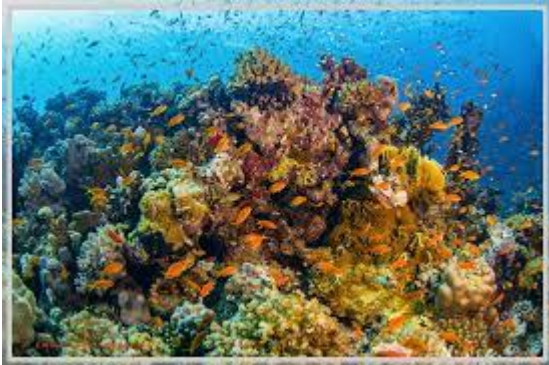
les récifs coralliens

Les milieux les plus riches en espèces semblent être les forêts tropicales humides, les forêts tropicales décidues, les récifs coralliens, les océans profonds, les grands lacs tropicaux et les régions au climat méditerranéen