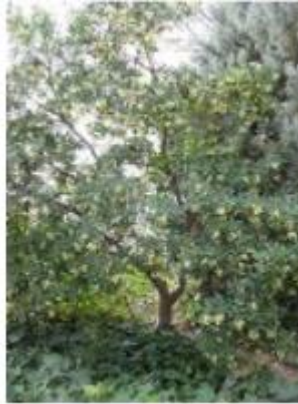
L'arbousier Arbutus unedo (Ericacées)