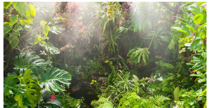
les forêts tropicales humides