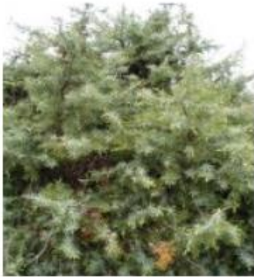
Le genévrier cade ou oxycèdre Juniperus oxycedrus (Cupressacées)