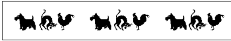
(trois cycles d'un chien, d'un chat et d'un coq)