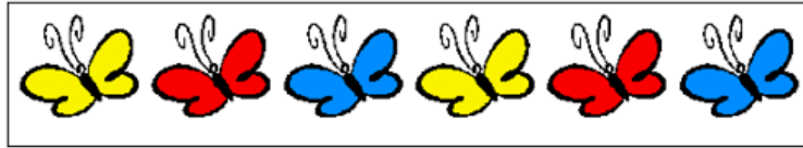
(deux cycles d'un papillon jaune, d'un rouge et d'un bleu)